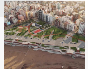
PLAZA ESPAÑA Y LA PERLA