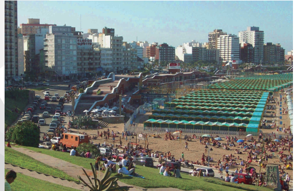
MAR DEL PLATA PLAYA LA PERLA